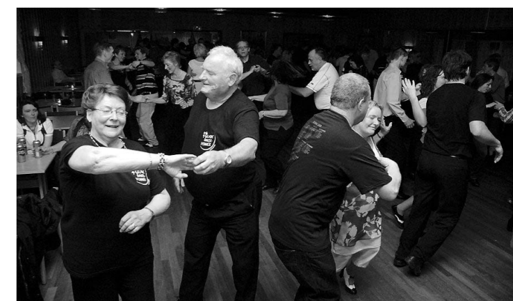
FULLT: En halvtime etter at dørene ble åpnet på Høyvang, måtte man stenge fordi det var fullt. Og alle var på dansegulvet!