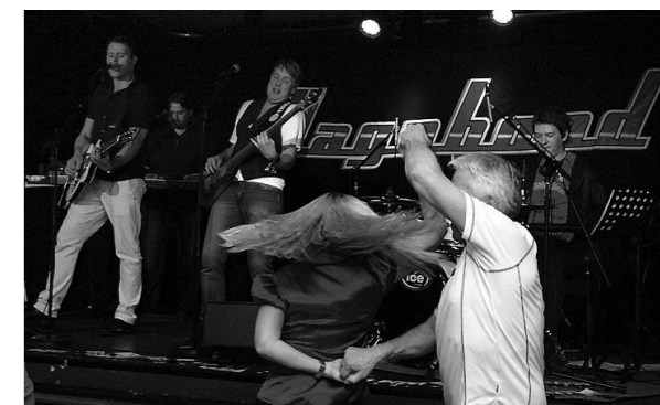
I FARTA: Når det spilles drivende rock'n roll, er det ikke mulig å stå i ro.